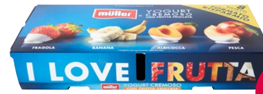
MÜLLER Yogurt Cremoso 8 vasetti x g 125