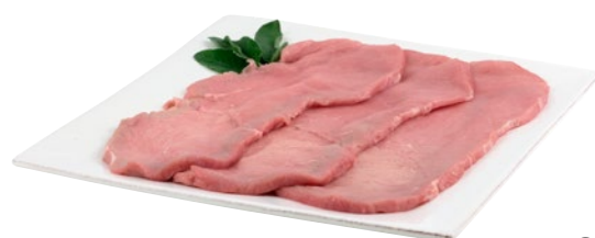
SCALOPPINE DI VITELLO