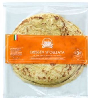
IL PANARO Crescia Sfoagliata Urbino g 450