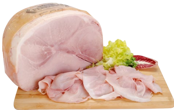
FERRARINI Prosciutto Cotto