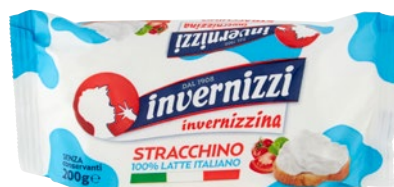
INVERNIZZI Invernizzina Stracchino g 200