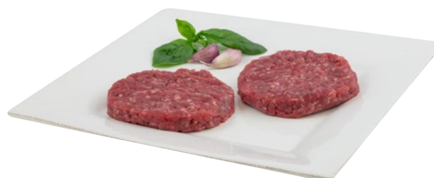
HAMBURGER DI BOVINO g 160