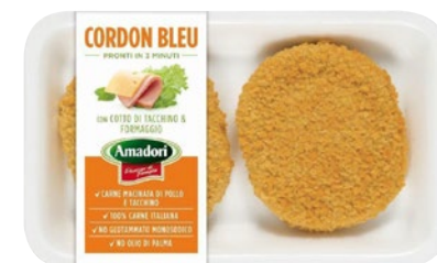
AMADORI Cordon Bleu g 250