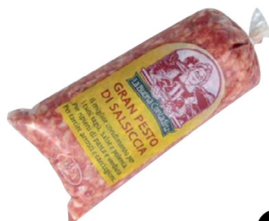
IMPASTO DI SALSICCIA DI SUINO