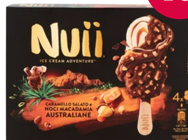
NUII Gelati 4 pz - g 272/264