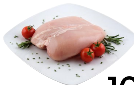
POLLO PETTO INTERO