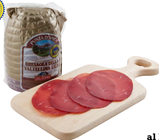
DEL ZOPPO Bresaola di Punta d'Anca IGP