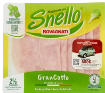
ROVAGNATI Snello Gran Cotto g 100