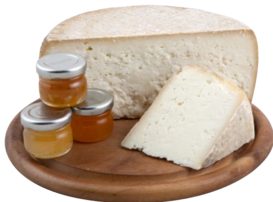
ANTICA CASCINA Pecorino Scaparolo