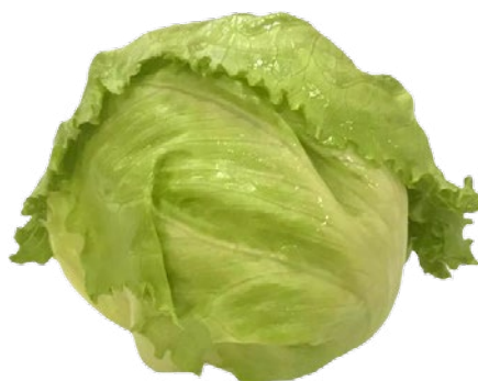
PRODOTTO ITALIANO LATTUGA BRASILIANA