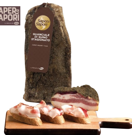
SAPER DI SAPORI Guanciale Stagionato