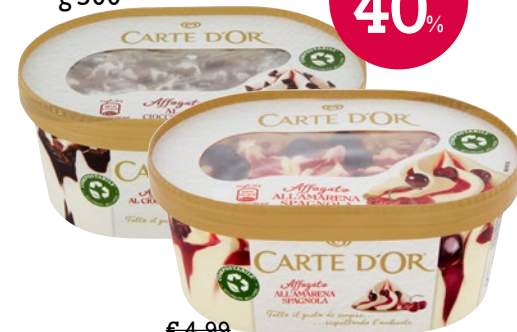
CARTE D'OR Gelato Affogato g 500