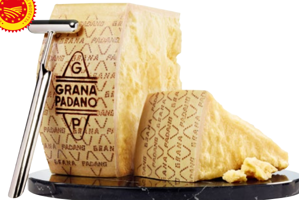
GRANA PADANO DOP g 500 circa