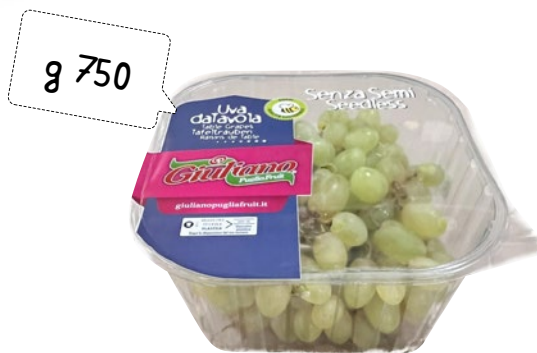
PRODOTTO ITALIANO UVA BIANCA SENZA SEMI g 750