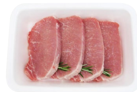
FETTINE DI LONZA DI SUINO