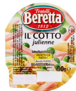
FRATELLI BERETTA Cotto Julienne g 90