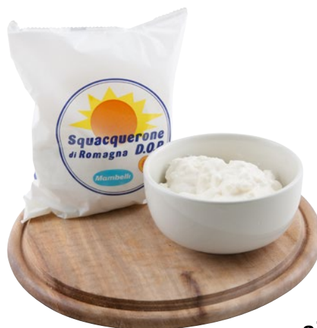
MAMBELLI Squacquerone di Romagna DOP