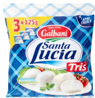
GALBANI Santa Lucia Mozzarella 3 pz x g 125